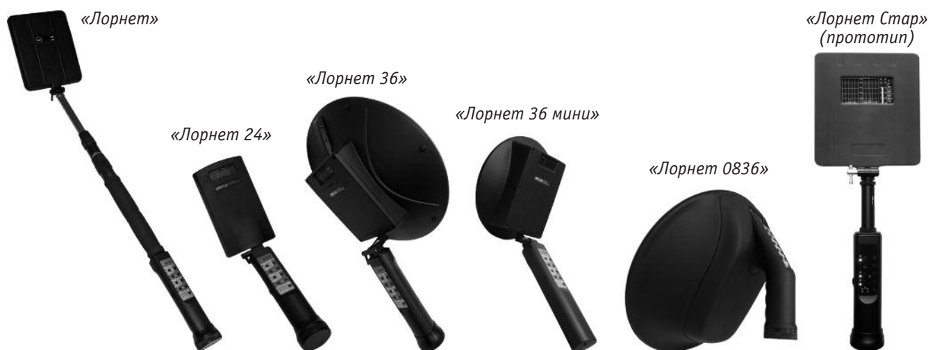
Рис. 1. Нелинейные локаторы серии «ЛОРNET»

ствии на нелинейный объект зондирующим сигналом превышение уровня принимаемого сигнала 3-й гармоники над уровнем 2-й гармоники, как правило, характеризует нелинейный объект как естественный – МОМ (металл – окисел – металл), а наоборот – как искусственный (полупроводник). На практике данное «теоретическое» утверждение справедливо только в среднем. Более тонким механизмом определения типа нелинейного объекта является прослушивание уровня паразитной модуляции при изменении расстояния до объекта или демодулированного отклика по 2-й и 3-й гармоникам после воздействия на объект механическим способом (простукиванием). В большинстве современных импульсных нелинейных локаторов для этой цели используется так называемый режим «20К» с прослушиванием на головные телефоны паразитной модуляции АМ (ЧМ). Заметим, что при простукивании МОМ-объект изменяет свои геометрические размеры, что приводит к изменению его нелинейных характеристик, которые оператор и пытается анализировать на слух.