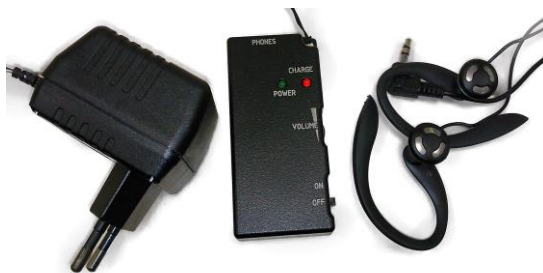
Рис. 2 На рис.2. показаны приемник, сетевой адаптер для зарядки его аккумулятора и наушники.