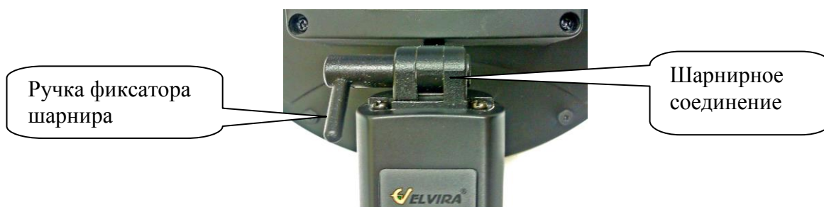
Рис. 4 Шарнирное соединение

4.2. Шарнирное соединение приемно-передающего антенного блока с ручкой (рис. 4) предназначено для перевода блока в транспортное положение и фиксации положение антенны, удобного для проведения, поисковых работ.