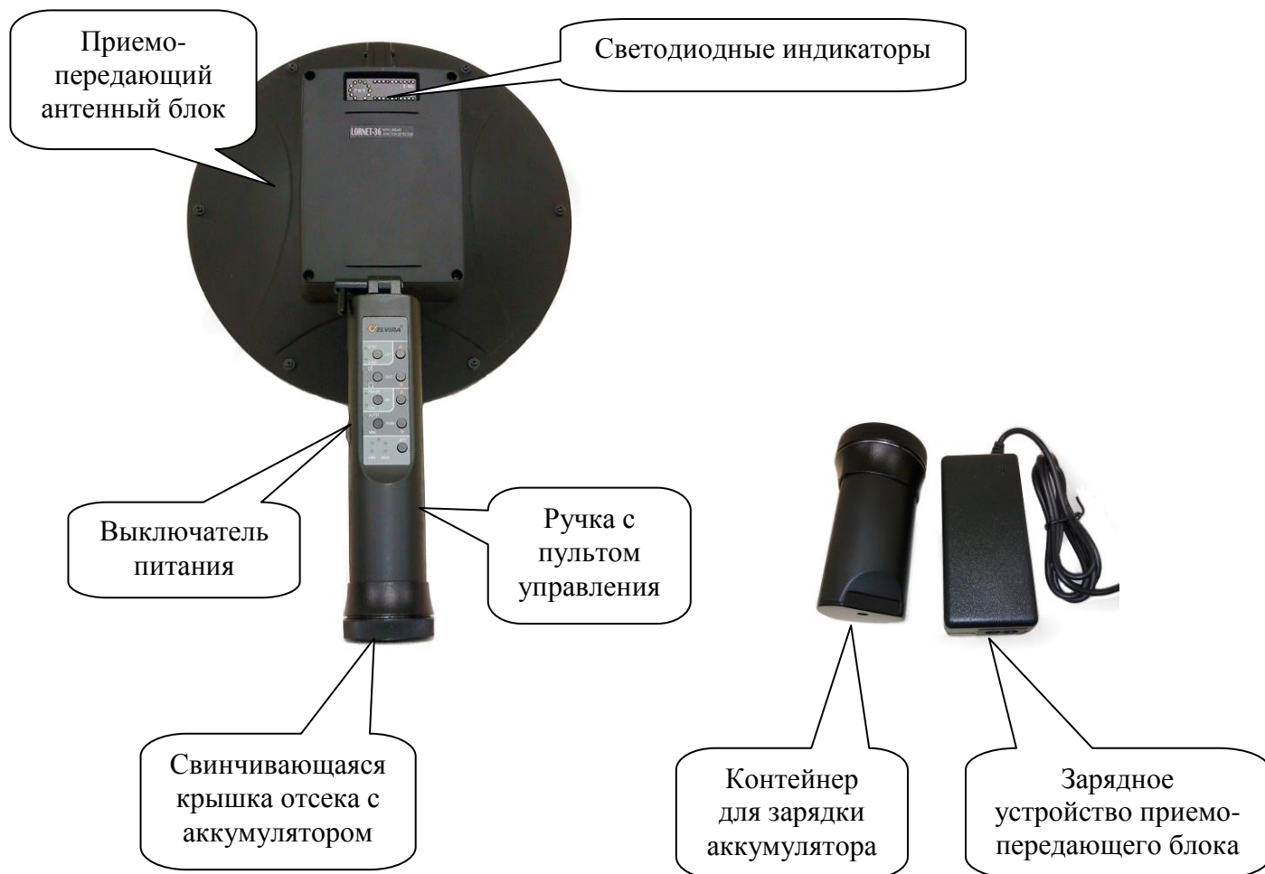
Рис. 1 Внешний вид обнаружителя и его зарядное устройство