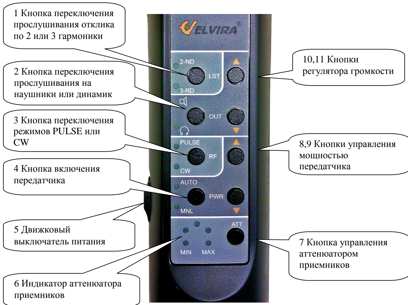
Рис. 5 Пульт управления

4.4. Функции индикаторов пульта управления: Непрерывное свечение любого индикатора соответствует положению «включено», отсутствие свечения – положению «выключено». Одновременное мигание всех индикаторов пульта управления указывает на разряженность аккумуляторной батареи и необходимость ее зарядки.